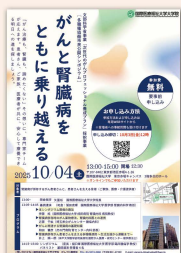
2025年度 がんとう腎臓病をともに乗り越える