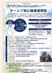
2025年度 チームで挑む腫瘍循環器