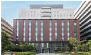
国際医療福祉大学三田病院 (東京都がん診療連携拠点病院)