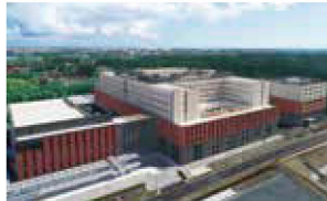
国際医療福祉大学成田病院 (病院機能評価 一般病院3)