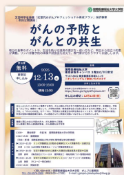
2025年度 がんの予防とがんとの共生